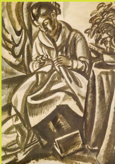
Uitz Béla: Varrónő, 1919